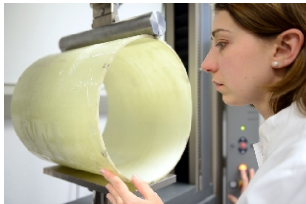
Initiële ringstijfheidsproef van liner-proefstuk

De drie keuringsafdelingen van IKT voeren bijzondere keuringen voor fabrikanten van producten uit: