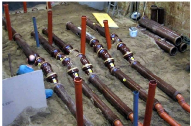
Opbouw van een leidingnetwerk in de grote proefopstelling van IKT.

Een bijzondere specialiteit van IKT zijn de productvergelijkingen , waarin producten en methoden onder laboratorium- en praktijkomstandigheden tot op de bodem worden