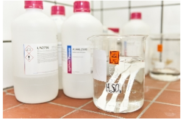
Bepaling van het gedrag tegen vloeibare chemicaliën