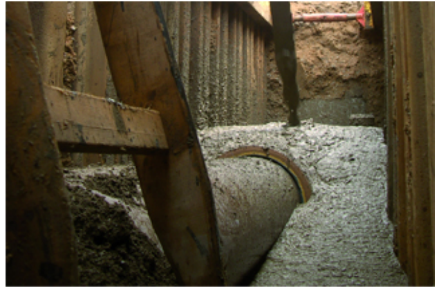
Porie-arm: Vloeibare bodem remt wortelgroei.

Passieve beschermingsmaatregelen zijn vooral te vinden in de bodem vlakbij de ondergrondse leidingen. Deze maatregelen worden toegepast bij nieuwbouw of vervanging van leidingen , wanneer er toch al gegraven moet worden. De keuze van de type maatregel hangt af van de omgevingsfactoren. De keuze kan vallen op de bovengenoemde worteldichte buisverbindingen, het gebruik van porie-arme bodemstoffen, maar ook het inbouwen van mantels om de buizen heen. Hetzelfde geldt voor platen en foliën die in de bouwsleuf ingebouwd kunnen worden om wortels en buizen uit elkaar te houden.